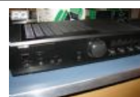
Amplificatori Integrati Denon PMA 495R € 150,00